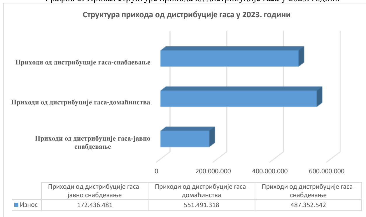
График 2: Приказ структуре прихода од дистрибуције гаса у 2023. години

У оквиру пословних прихода Предузећа евидентираних у 2023. години, највеће учешће имају приходи од дистрибуције гаса који су остварени у укупном износу од 1.211.280.341 динар, а чија структура је приказана у следећем графичком приказу: