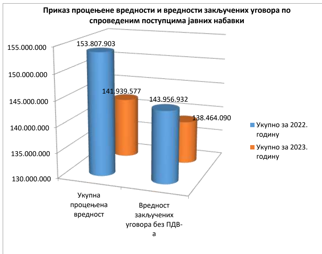
График 1: Приказ процењене и вредности закључених уговора по спроведеним поступцима јавних набавки у 2022. и 2023. години